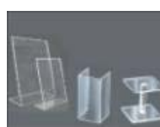
Hüllen / Aufbauten