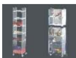
Ideen aus Acrylglas

Ich / Wir möchten unsere Unterlagen per (bitte unbedingt angeben) Katalog per Post Katalof auf CD-Rom (pdf) e-mail pdf-Datei (Acrobat Reader)